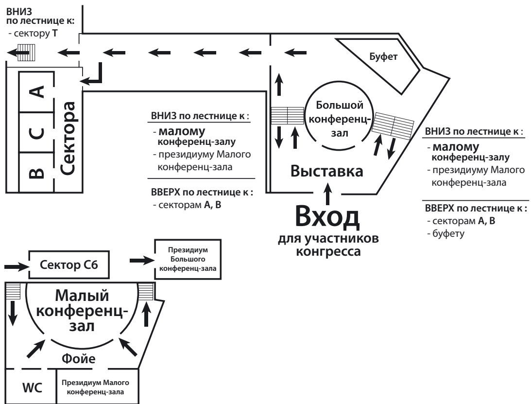
Схема расположения залов